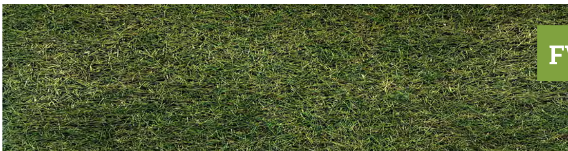
休眠期前コウライ芝 FW原液3ml/l m 2 希釈濃度15倍