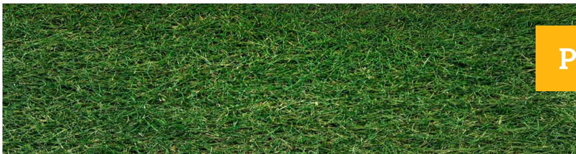
休眠期前コウライ芝 P+原液3ml/l m 2 希釈濃度15倍